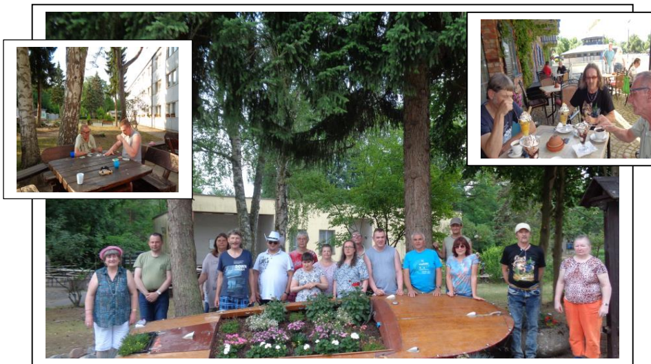
Die Bewohnerfreizeit bei Rheinsberg – wieder ein tolles Erlebnis.